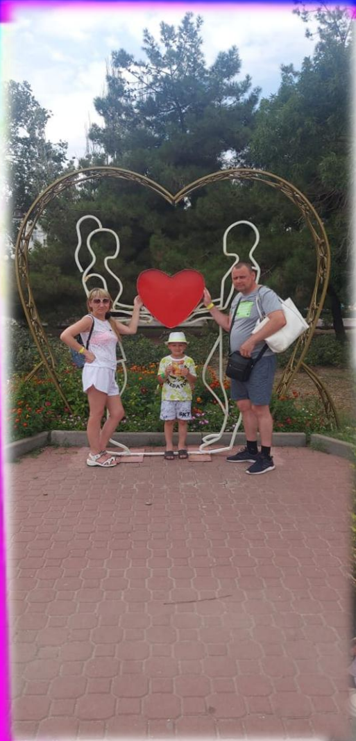
Краснодарский край г. Керчь