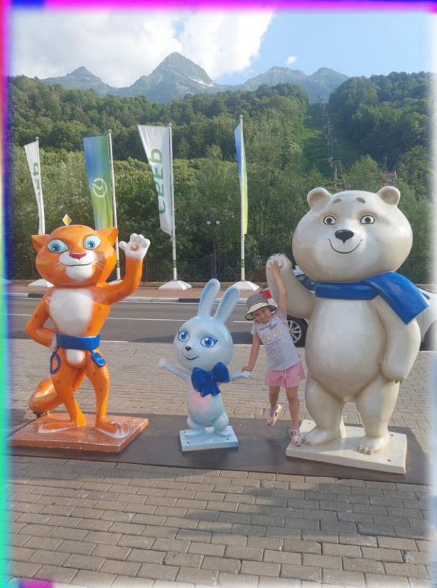
г. Сочи Красная поляна