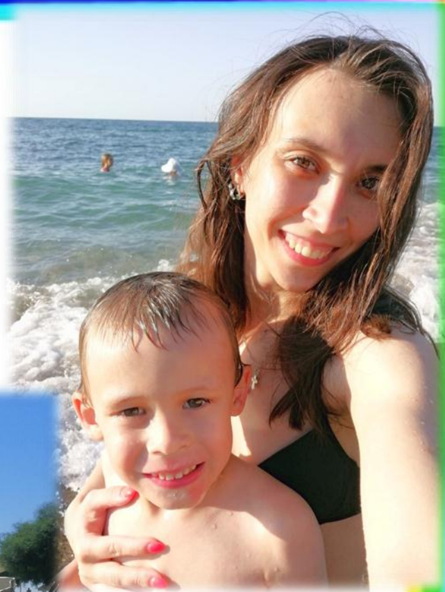
Турция г. Алания