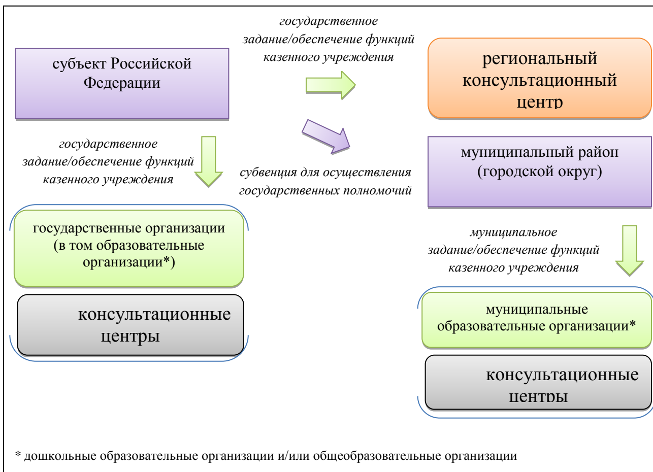
Рисунок 2 - Организационно-финансовая схема функционирования консультационного центра на уровне субъекта Российской Федерации

Органы государственной власти субъекта Российской Федерации: