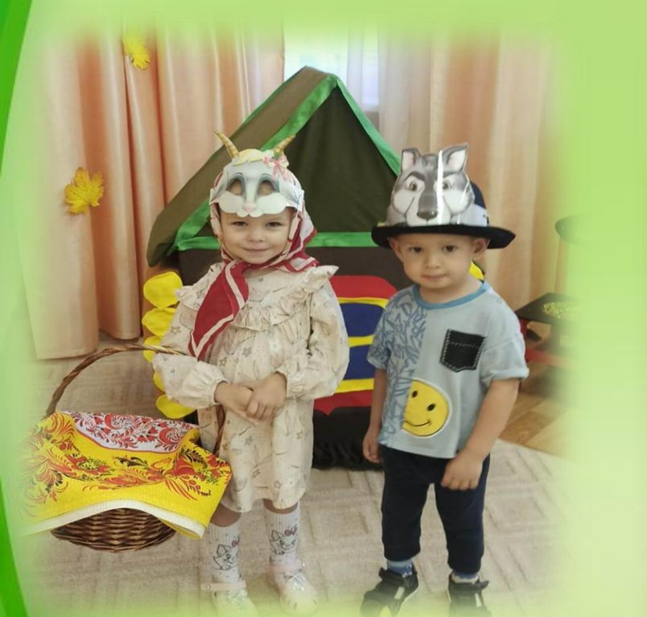
Мама - коза и серый волк