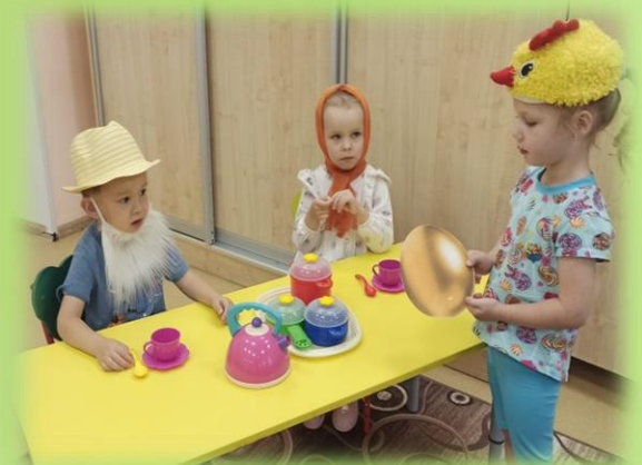
Театрализованная постановка сказки \Delta Курочка Ряба.