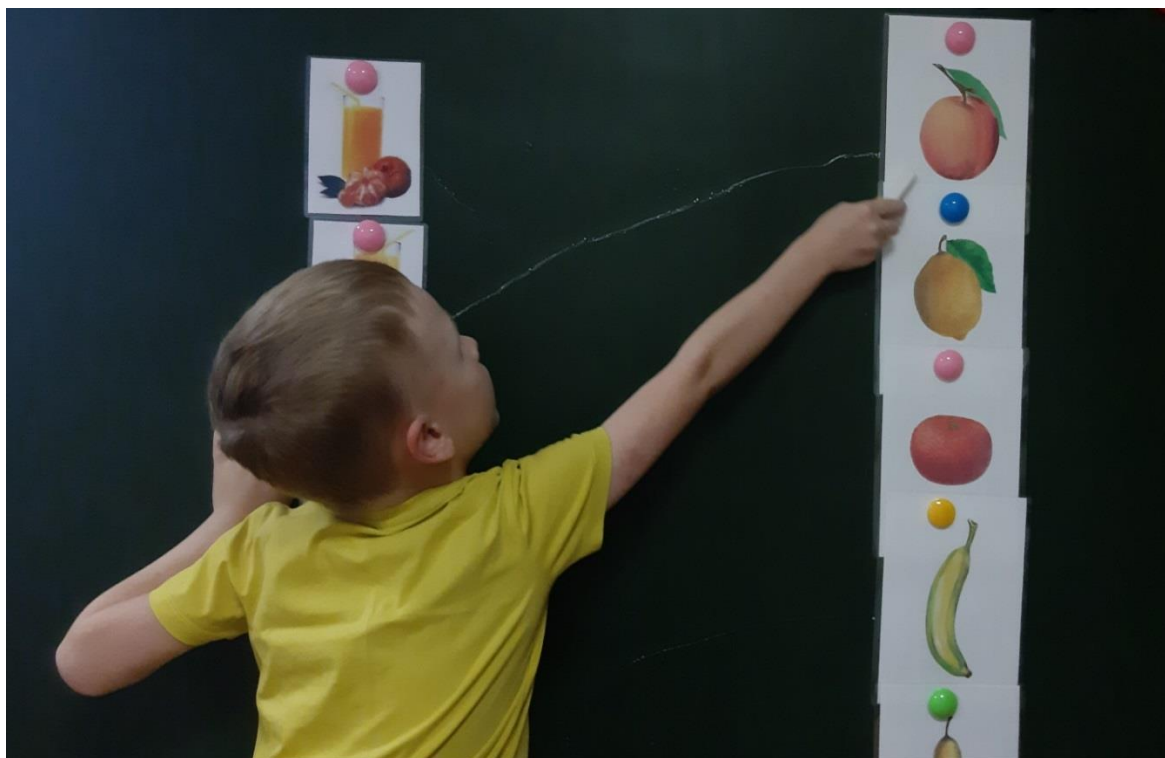
Игра «И чего сок?»