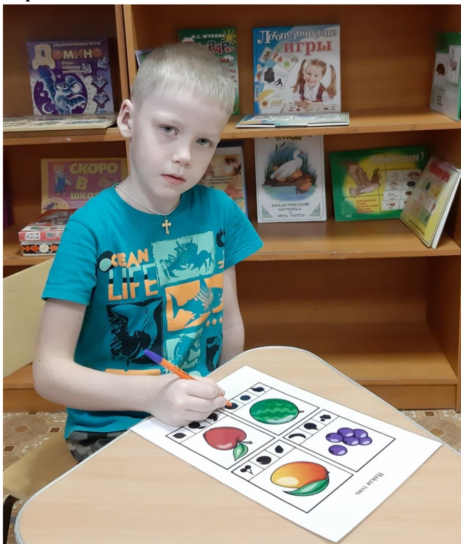
Игра «Найди тень»

Фото игр с тематического занятия «Грибы»