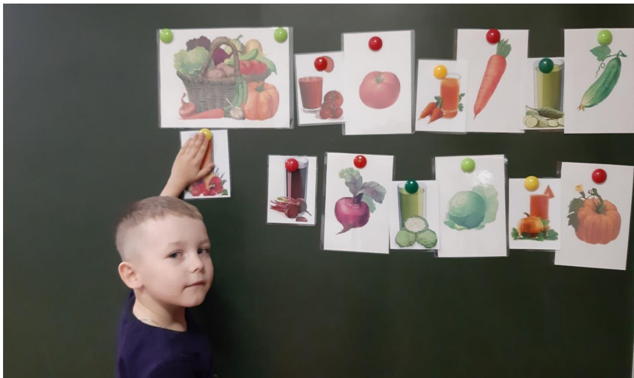
Фото игр с тематического занятия «Овощи»