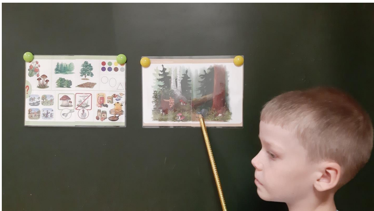
Игра «Составь рассказ»