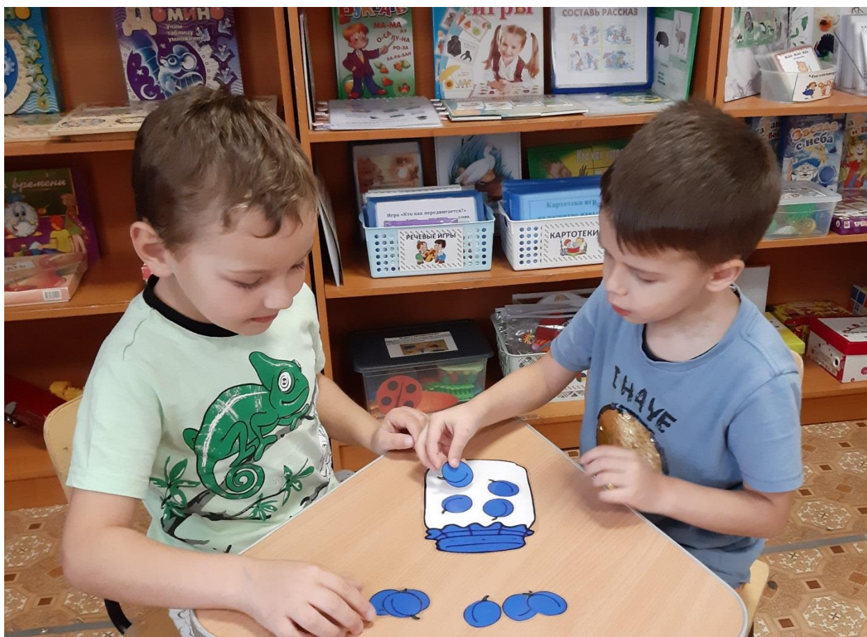
Игра «Варим компот»