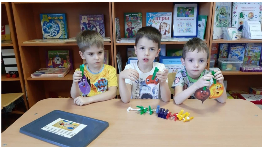
Игра «Чего не хватает?»