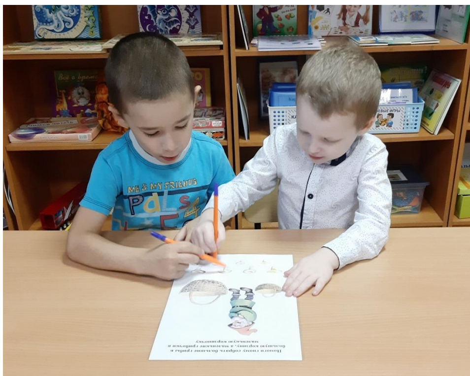
Игра «Большой – маленький»