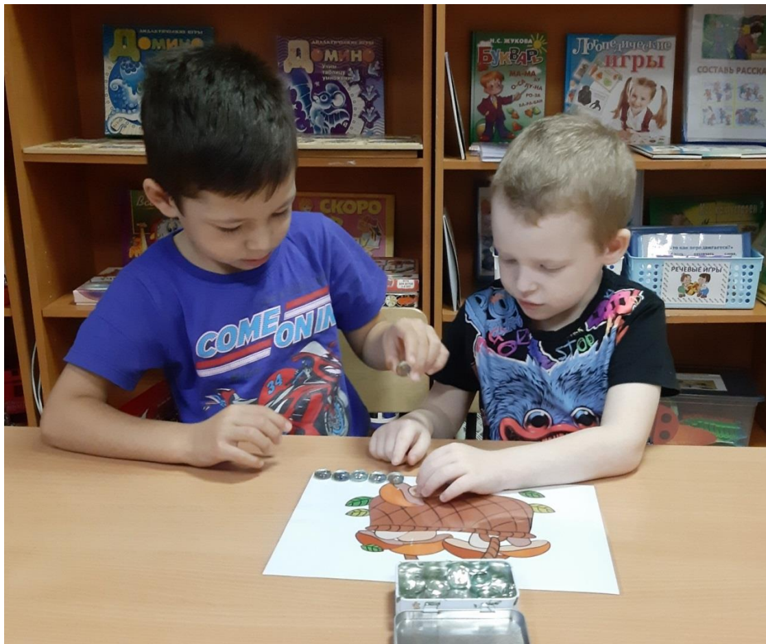
Игра «Сколько в корзине грибов?»