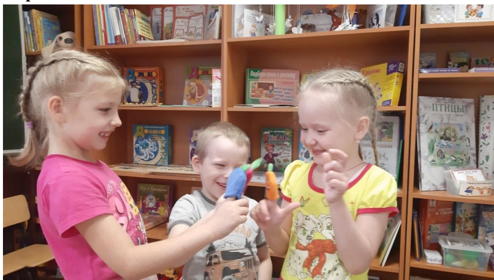
Игра «Овощной переполох»

Фото игр с тематического занятия «Фрукты»