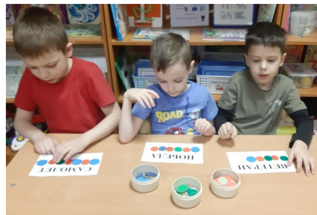
Игра «Звуковая схема»