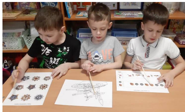
Игры «Найди одинаковые», «Найди по контуру», «Продолжи ряд»