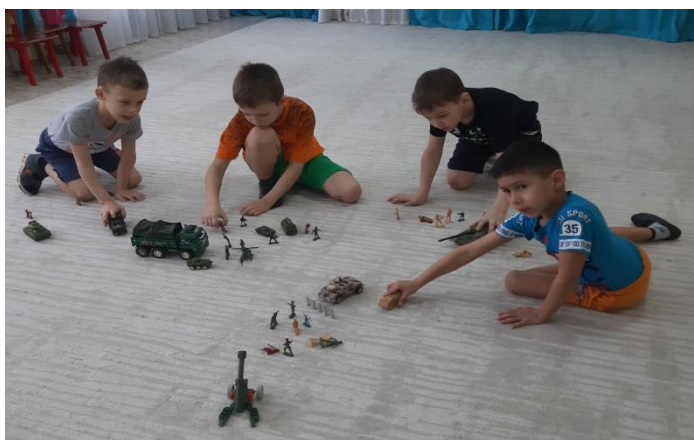
Игра «Подготовка к бою»