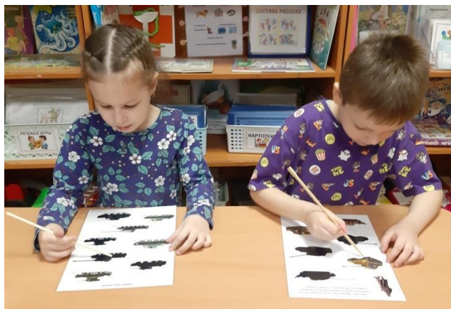
Игра «Найди тень»