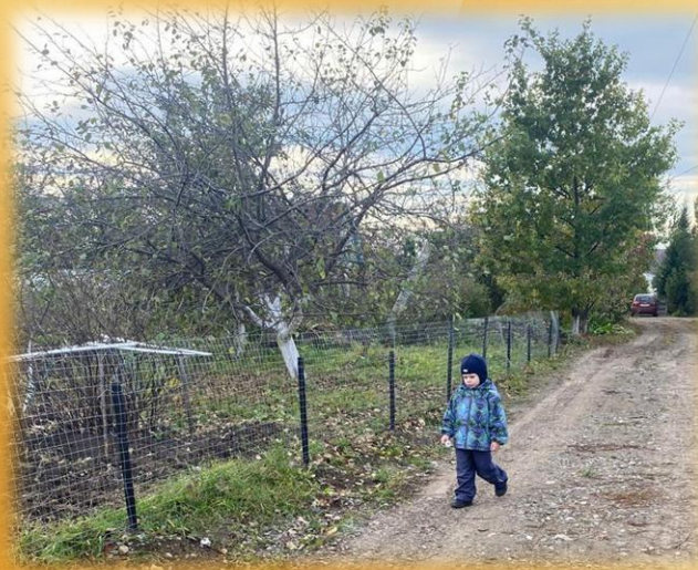
Пейзаж: «Просторы детства»