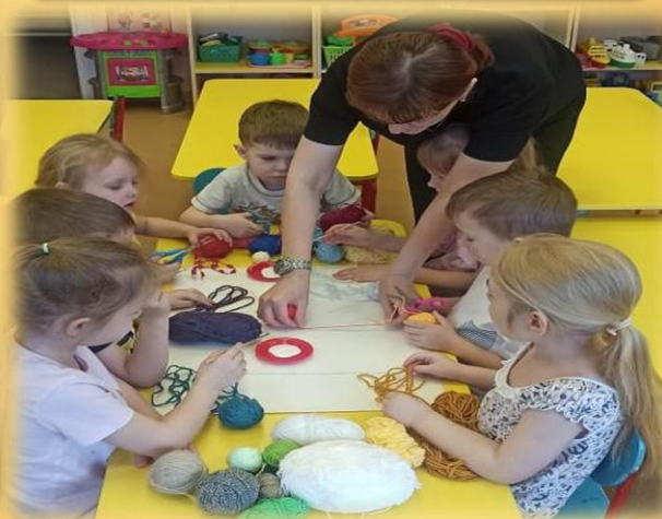
Выкладываем рисунок с помощью разноцветных ниток и клея на полотно