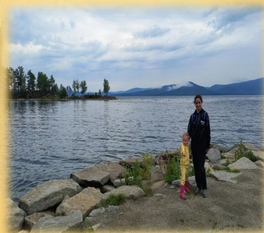
Пейзаж: «У водоема»