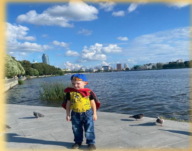
Пейзаж: «На берегу реки «Исеть»