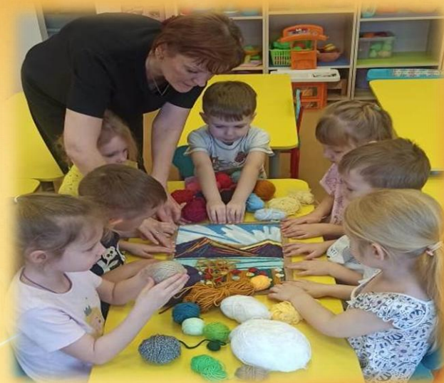
Закрепляем картину в рамку