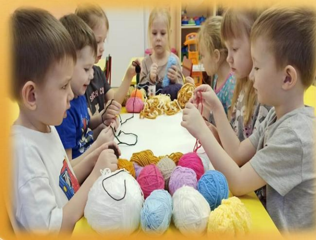
Подбор ниток разной цветовой гаммы