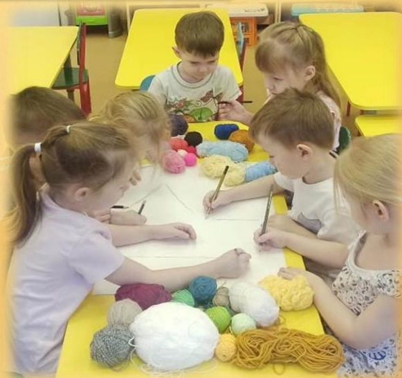
Простым карандашом наносим контур будущего пейзажа